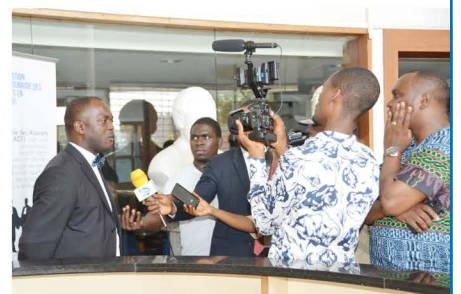
Réaction du Président de l'ACADS à la fin du séminaire