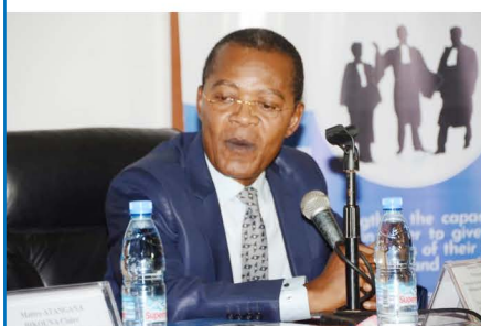
Intervention du Pr Magloire ONDOA